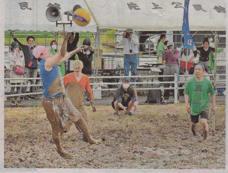
泥にまみれてソフトバレーを楽しむ参加者＝29日、鯖江市大野町